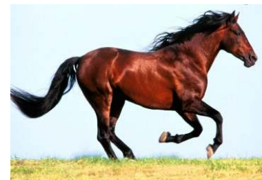
Obr. č. 1: Popis obrázka (Times New Roman, 10, tučné)

zaradiť bezprostredne za textom, kde sa spomínajú po prvýkrát (najlepšie na tej istej strane). Obrázok by mal byť podľa možnosti centrován (na stred riadku). Pri odkazovaní na daný obrázok (podobne na tabuľku) v texte použijeme odkaz uvedený v zátvorke (napr. Obr. 1).